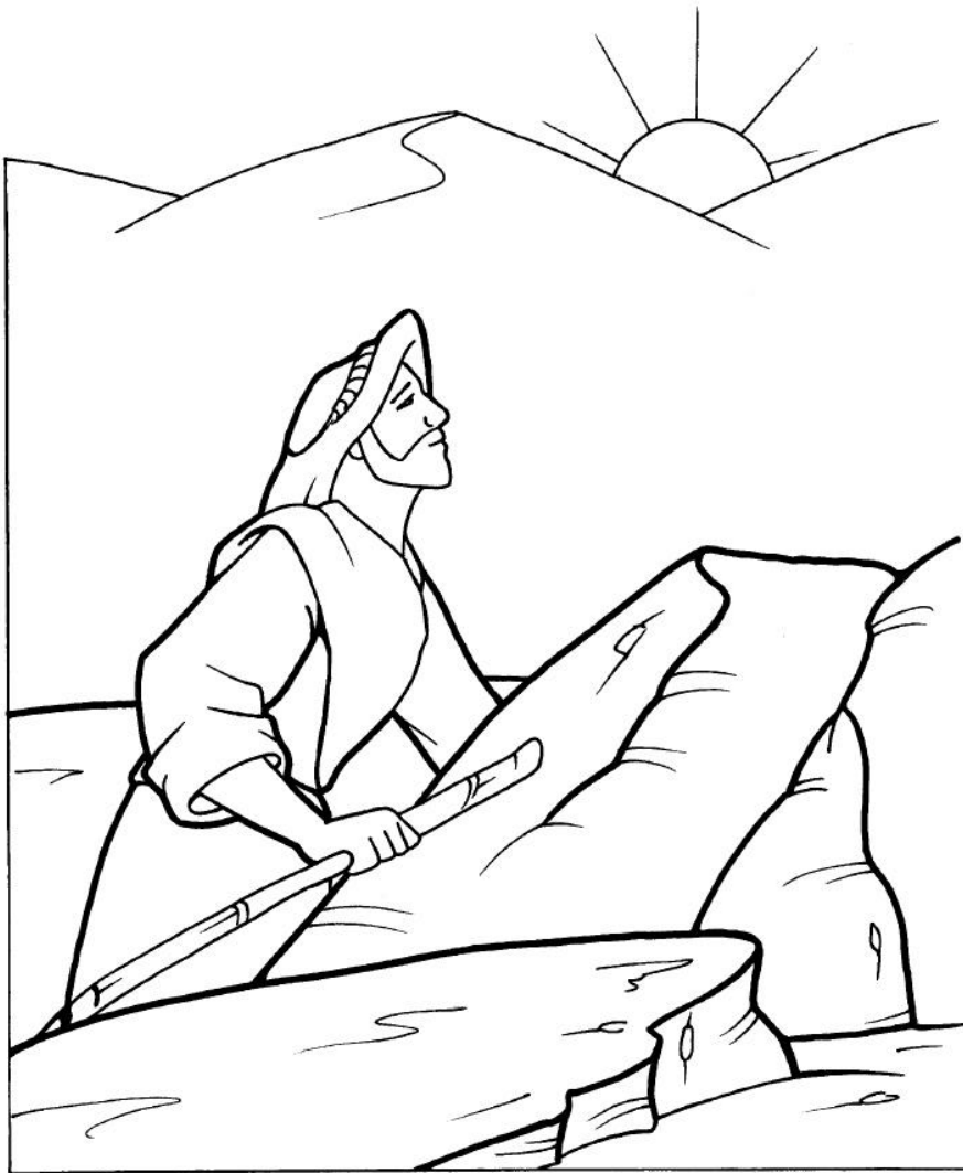
La tentación de Jesús